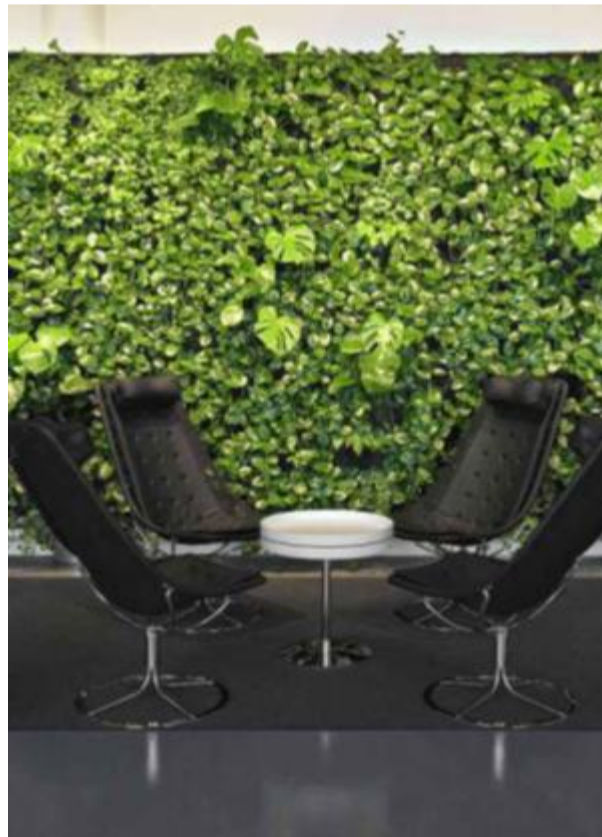
Green Room: Artister som besøker kongress- og konsert-senteret i Uppsala får nytte godt inneklima.

blant annet sykefraværet med 50 prosent etter at de fikk sitt grønne kontor.