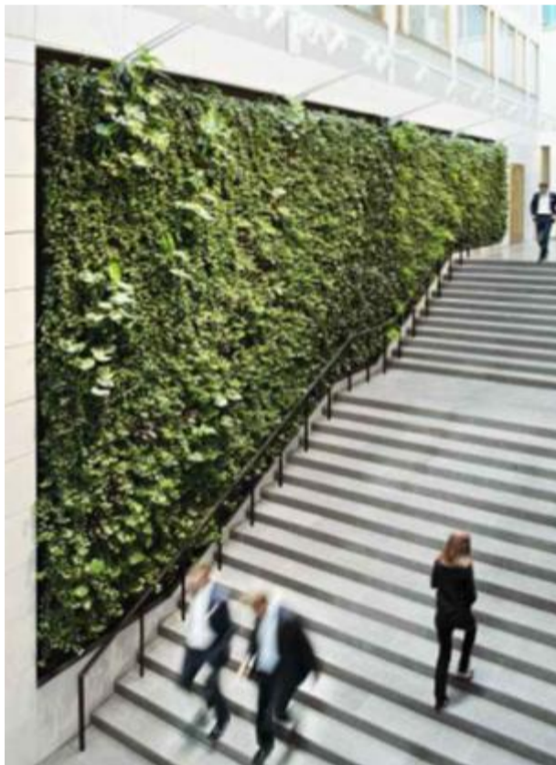
Advokatkontor: I Stockholm, levert av Green Fortune. Vekstvegger har også en dekorativ funksjon.